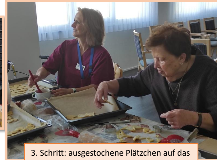
3. Schritt: ausgestochene Plätzchen auf das Backblech legen