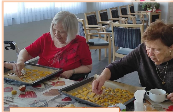
5. Schritt: mit Streusel dekorieren