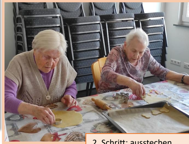
2. Schritt: ausstechen