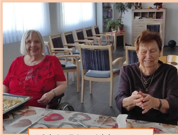
1. Schritt: Teig weich kneten und ausrollen