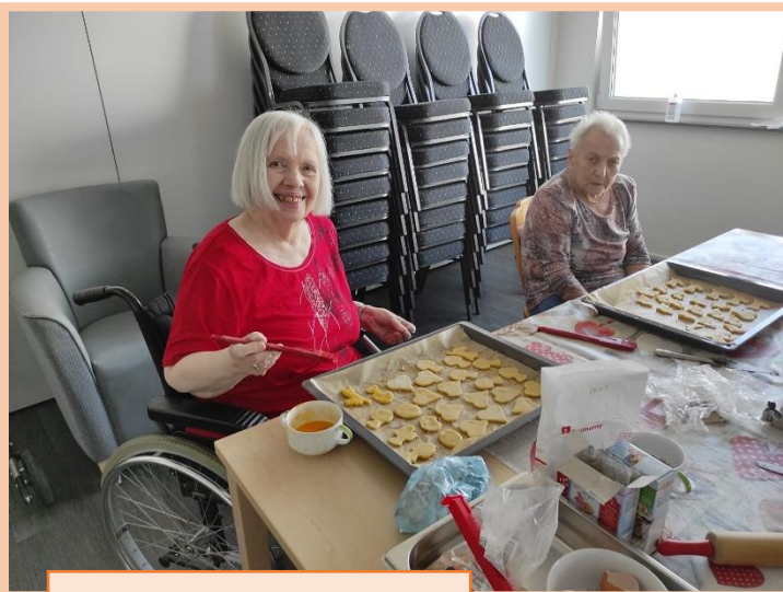
4. Schritt: mit Ei bepinseln